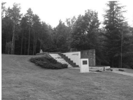
Слика 3: Споменик палих бораца Црвене армије