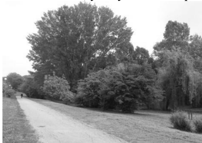
Слика 1: Пешачка стаза, улаз у спомен-парк Чачалица