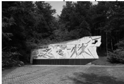
Слика 2: Споменик стрељаним родољубима